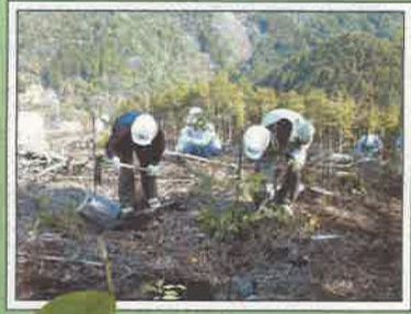
山への植樹が美しい水をつくり出します