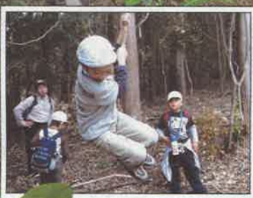
学んで遊べる森林づくり