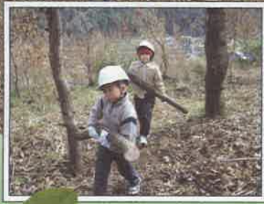
里山の木を守り育てます