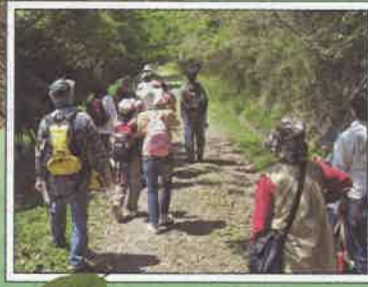
こみちみどりの小径で森林浴