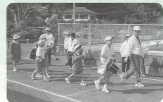
下校時に子どもたちを見守る

八代海に面し、観光うたせ船の発着場所として知られる芦北町計石地区。平成十一年四月、行政区長や民生児童委員、老人会など、各組織の代表者が集まって、地区の行事やルールを決める