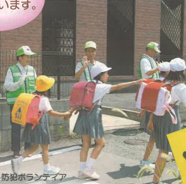
防犯ボランティア