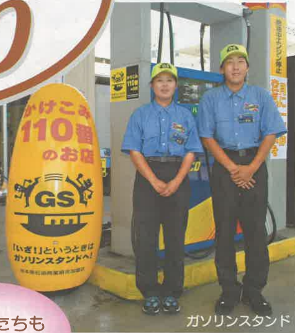
ガソリンスタンド