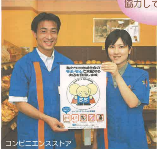
コンビニエンスストア