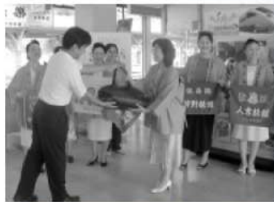
「おひとよし人吉手ぶらでチェックイン」(人吉駅)

「人吉・球磨地域には、温泉や球磨川下りのほかに、相良三十三観音めぐりやひなまつり、『球磨川ラフティング(ゴムボートでの川下り)』など四季を通して観光資源が豊富にあります。また、JR肥薩線人吉〜吉松(鹿児島県)間の「いさぶろう号」「しんべい号」のんびり車窓が楽しめる」と評判も上々です。現在は九州・山口からのお客さまが中心ですが、今後は九州新幹線の全線開業も視野に入れて、関西方面からのお客さまにもお越しいただけるよう、これらの観光資源を生かした魅力あるコースづくりをしていきたいですね」と意欲的。地元の大きな期待を背負い、明るく元気な女将たちの活動はこれからも続きます。