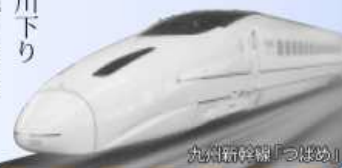
九州新幹線「つばめ」

全六回にわたり九州新幹線先行開業後の県内各地の取り組みを紹介してきました。県では新幹線開業効果を生かした地域振興策を進めるため、今年度から市町村や民間団体などとともに「新幹線くまもと創りプロジェクト推進本部(仮称)」を立ち上げる予定です。平成二十三年の九州新幹線全線開業へ向け、県内各地域の活性化に取り組んでいきます。