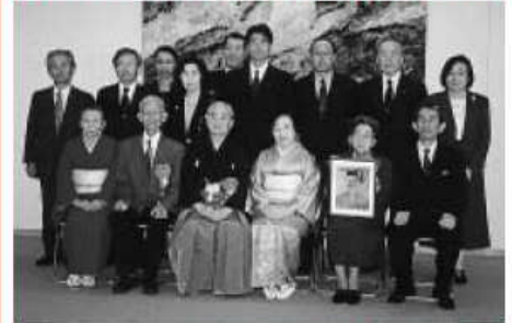
平成13年度に顕彰を受けられた方々

熊本県教育委員会では、本県出身または在住者(故人を含む)で、近代文化の発展に著しい功績があった方を毎年顕彰(けんしょう)しています。顕彰式には自由に参加できます。