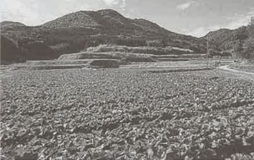
久重地区からみた久重山(三池山)

かを作ってやったりして、とてもかわいがっていました。この村は、山からわき出るわき水により、山の中腹までよく耕され、みんなの暮らしは豊かでした。これも山の神さんのおかげと村人は深く信心していました。けれども秋祭り