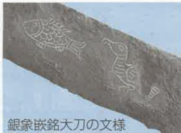
銀象嵌銘大刀の文様

展覧会では、国宝とあわせて熊本の技と美を代表する名品や人間国宝の作品を展示し、熊本の豊かな文化と優れた技を紹介します。