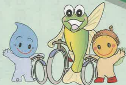
自転車道のマスコット 左からサラリン、アユリン、コロリン

健康づくりや日ごろのストレス発散に自転車に乗ってもよし、歩くもよし、走るもよし。自動車の通らない道を自分のペースで体験してみませんか。