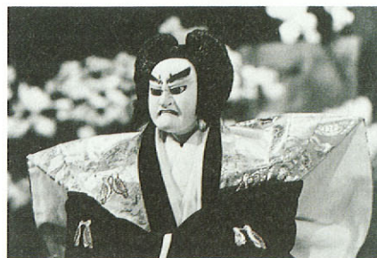
「一谷嫩軍紀」 熊谷陣屋の段