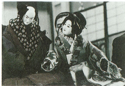
「翼途の飛脚」 封印切の段