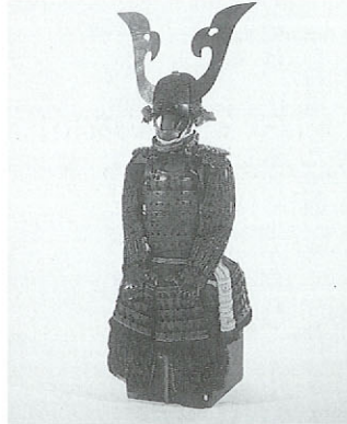
くまがたつばねといはむべいとあそびくま 栗色革包紮糸射向紅糸威員足 (江戸時代初期)