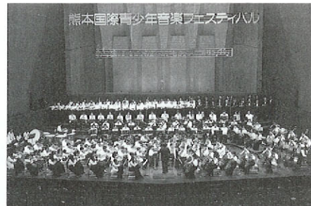
昨年の熊本国際青少年音楽フェスティバルより