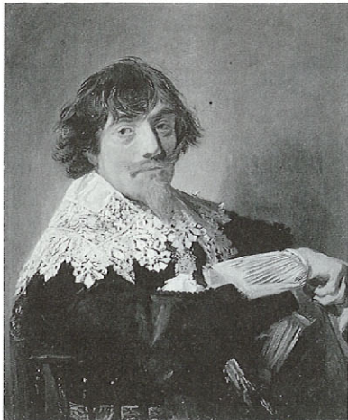
「ニコラス・ハッセルール」