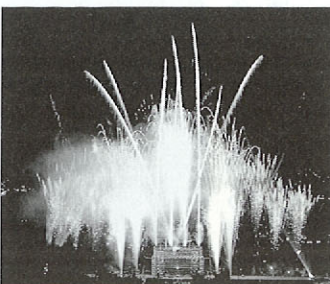
ラストサマーファンタジー