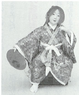
笠鉾・イン・ミュージアム「聖々」