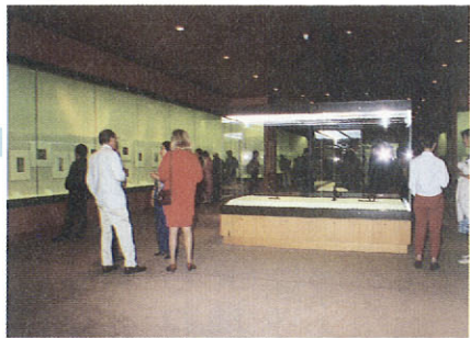
大英博物館で開催された個展から

私が小学生の頃、日本で初めて出版された「世界美術全集」を父が買いました。それをいつも見ていた私は、美術に興味を持ち、中学二年の時には、将来、画家になろうと決意していました。 でも、美術学校卒業後、陸軍入隊。まる五年間に及ぶ軍隊生活を体験しました。軍隊では、自殺ばかり考えていました。肉体的苦痛には耐えられる。しかし、納得できない戦争に加担していることや軍隊の理不尽さが、何よりも辛かったです。そして、それを口にすることもできない絶望感。初期の作畫「初年兵哀歌」(連作)の二等兵の姿。あれは私自身です。 中国の荒涼とした景色の中で、たくさんの死体を見ました。ゴムマリのように膨れあがった死体。ウジのわいた死体。人間をモノとしてしか扱わない戦争。人間の喪失。私はこれらを画家