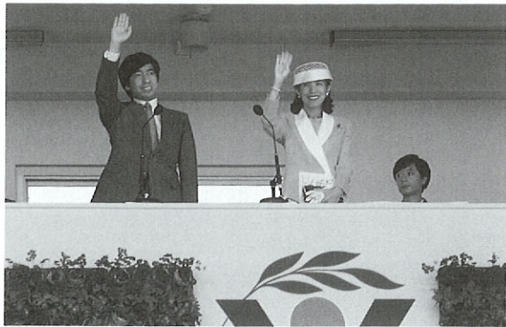
高円宮同妃両殿下も各競技場で観戦されました