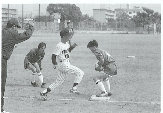
「アウト!!」守備もバッチリの熊本チーム