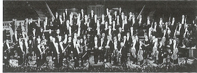
ロイヤル・アムステルダム・コンセルト・ヘボウ管弦楽団コンサート