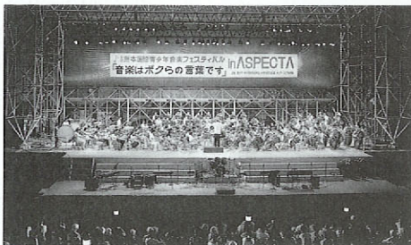
熊本国際青少年音楽フェスティバルinASPECTA