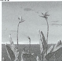
「湿原-早晩の譜」井澤 幸三