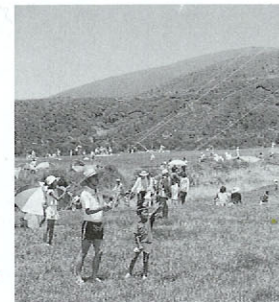
大阿蘇全国風上げ大会