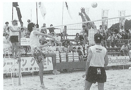
ビーチバレーボールインクマモト