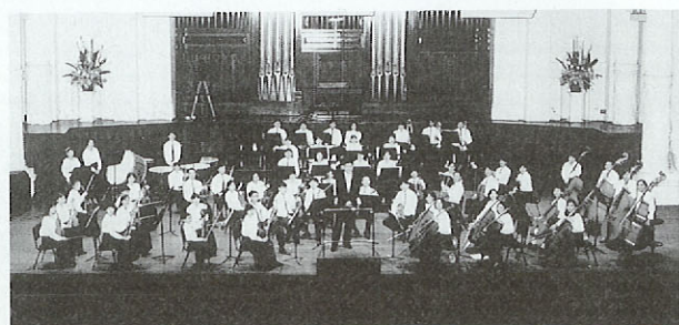
国際青少年音楽フェスティバルオープニングコンサート