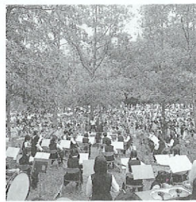
はなしのふコンサート