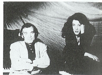
マルタ・アルゲリッチ& ラビノビッチピアノデュオ