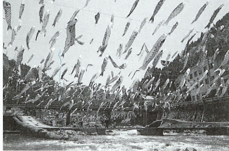
杖立のこいのぼり