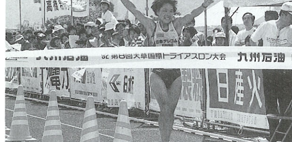
天草国際トライアスロン大会