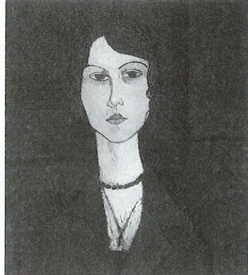
アメデオ・モディリアニ(首飾りの女)1917年