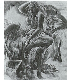
家族の情景 / 磯谷精一