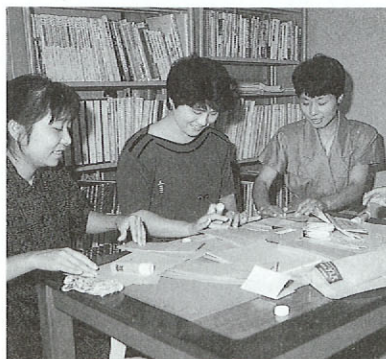
和気あいあいど「なかよし通信」の発送作業

現在、主婦を中心とした十名のボランティアが、この「おもちゃ図書館」を支えます。仕事は、弱性石鹸でおもちゃの消毒をしたり、おもちゃを手作りしたりなど。今回は「なかよし通信」発送の手伝いをさせてもらいました。作業をしながら子育ての話に花が咲きます。「障害を持った子ども