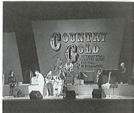
アスペクタカントリーゴールド