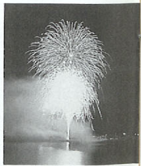
第4回やつしろ全国 競技大会