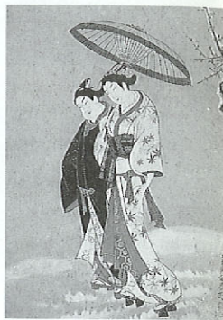
今西コレクション名品展Ⅲ 宮川一実「雪中男女図」