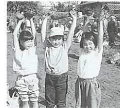
からいもフェスティバル in おおづ