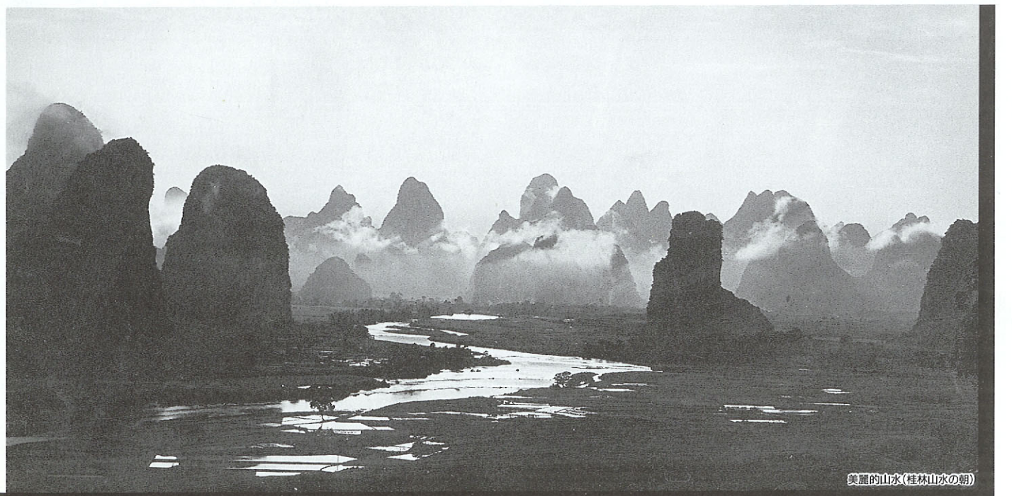
美麗的山水(桂林山水の朝)

去る6月8日から13日まで、広西壮族自治区主席一行が来熊。来年の姉妹提携10周年に向けての交流協議が持たれました。