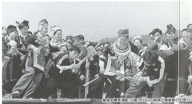
歌舞妙舞笑滿坡(旧暦1月15日の苗族の跳坡節のお祭り)