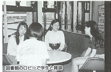
図書館のロビーで学生と雑談

大学では、私たちが提出するレポートの文法を皆で見てくれたり、私たちが漢文の解釈を解説したり、お互いに協力し合って勉強しています。