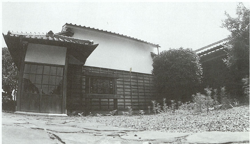
小楠旧居 四時軒 ■お問い合わせ■ 熊本市横井小楠記念館(四時軒) (096)368-6158

実学はその性格からいって、どうしても情況追隨的です。幕末の熊本の場合、商工業、ブルジョアジーの発展がなかったこともあり、保守的な風土をつくり上げたことからわかるといって、真の意味の実学は、情況に左右されない一本の筋を持たなければならぬのではないのでしょうか。現代社会はまさに実学的情況です。いまこそ横井小楠をもう一度、見直すべきだと思います。