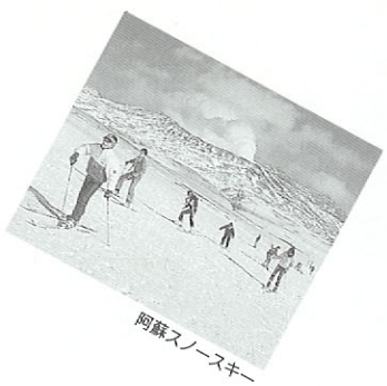
阿蘇スノースキー