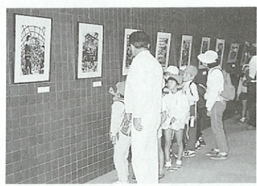
熊本聾学校 版画展

お問い合わせ(096)384-5000 ~12月27日(水) 1Fギャラリー 熊本聾学校版画展 12月1日(金)~12月14日(木) 第一研修室 たのしい絵本展 1月9日(火)~2月18日(日) 1Fギャラリー 熊本市立高校美術展 1月中旬 第一研修室 郷土出版物展