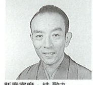
新春寄席・桂歌丸