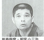
新春寄席・柳家小三治