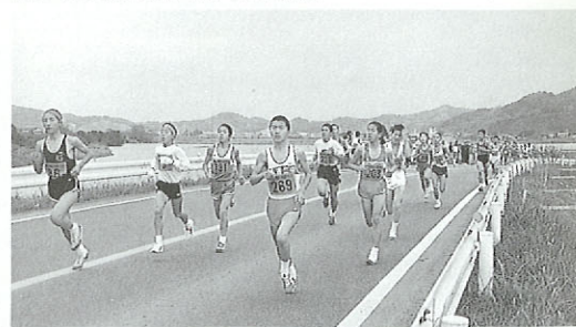
甲佐10マイル公認ロードレース

12月3日(日) 本渡市民センター 歳末たすけあい演芸会 お問い合わせ(096)23-1111 本渡市役所 12月3日(日) 牛深市民グラウンド 海中公園マラソン大会 お問い合わせ(096)72-6311 牛深市教育委員会 12月7日(木) 人吉インターチェンジ周辺 九州縦貫自動車道人吉~八代間開通式 お問い合わせ(096)24-2622 道路公団人吉工事事務所 12月8日(金) 県立劇場コンサートホール 障害者の日 ふれあいフェスティバル'89 お問い合わせ(096)383-1111 熊本県障害福祉課 12月9日(土) 玉名市民会館 玉名市民合唱団演奏会 お問い合わせ(096)73-2111 玉名市役所 12月9日(土)~12月10日(日) 菊池少年自然の家 自然に親しむ親子のつどい(正月をつくろう) お問い合わせ(096)27-0066 菊池少年自然の家 12月9日(土)~12月10日(日) 人吉市石野公園 クラシックカーレビューin人吉 お問い合わせ(096)22-2111 人吉市役所 12月10日(日) 甲佐町公民館~白旗 甲佐10マイル公認ロードレース お問い合わせ(096)234-2447 甲佐町役場