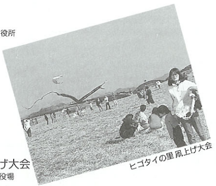
ヒゴタイの里風上げ大会