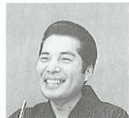
新春寄席・三遊亭円楽

お問い合わせ(096)363-2233 12月17日(日) 13:30~18:30~コンサートホール 日常塾 公開講座と講演会 12月24日(日) 18:30~コンサートホール ベートーヴェン 第九演奏会 1月7日(日) 13:00~18:00 演劇ホール 天草音楽祭「天草物語」 1月13日(土)~1月15日(月) コンサートホール他 音楽セミナー 一合唱・器楽の指揮・指導一 1月15日(月) 13:30~コンサートホール ニューイヤール・オペラコンサート 1月18日(木) 19:00~ 演劇ホール 新春寄席 1月27日(土) 14:00~1月28日(日) 演劇ホール 若戸神楽三十三座