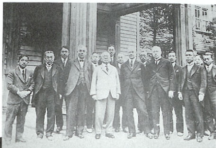
昭和5年(1930)欧米学者の表敬訪問時 (写真中央が北里柴三郎)