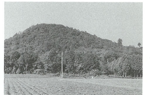
●弁天山公園 町のシンボル、弁天山。平成5年度完成を目指し、現在広場、展望所、町民の森、薬草園などの整備が進められています。

近年、熊本市のベッドタウンとして急速に都市化が進む西合志町。人口急増中のこの町の一番の課題は、地域内のコミュニティをいかにうまくとっていかしていくこと。ふれあいとぬくもりのあるまちづくりを目指して、元気な活動がこちらから行なわれています。