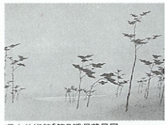
県立美術館「第3期収蔵品展」

熊本近代文学館 お問い合わせ(096)361-6720 ～3月30日休まで 熊日文学賞に見る現代熊本の作家展