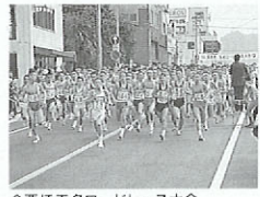
金栗杯玉名ロードレース大会

熊本県立美術館 お問い合わせ(096)352-2111 ～2月26日休まで 2F展示場 第3期 収蔵品展