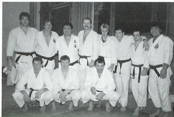
インターナショナルトレードキャンプ(国際柔道合宿)でベルギーチームと。(1987.2)