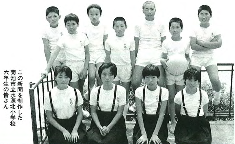
この新聞を制作した菊池市立水源北小学校六年生の皆さん