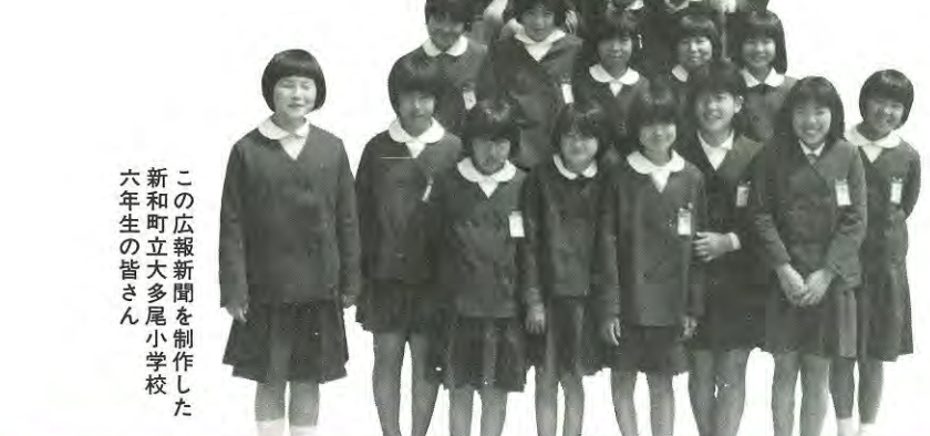
この広報新聞を制作した新和町立大多尾小学校六年生の皆さん

一方、雲仙・天草国立公園内の竜洞山一帯(標高二三八メートル)には、本県で最初に造られたふれあいの里「緑の村」(キャンプ場、バンガロー、テニスコート、動植物園など)があり、県内外からの観光客や行楽客で賑わっています。また、鹿児島―天草―雲仙を最短距離で結ぶ「天草ロザリオライン」の中継点になり、そのフェリー発着所内には、鎌倉時代から江戸時代に至るまでの文化財や漁具資料が展示されている歴史民俗資料館があり、町の歴史を知ることができます。