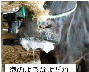
泡のようなよだれ