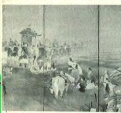
高橋広湖「賀茂詣風」部分