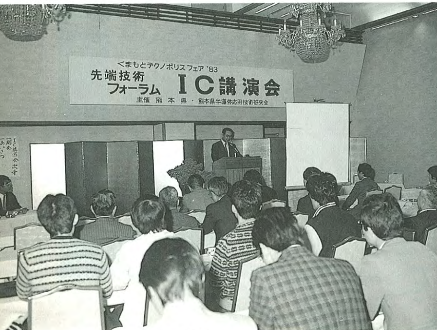
● 県内の多くの技術者に感銘を与えたIC講演会会場