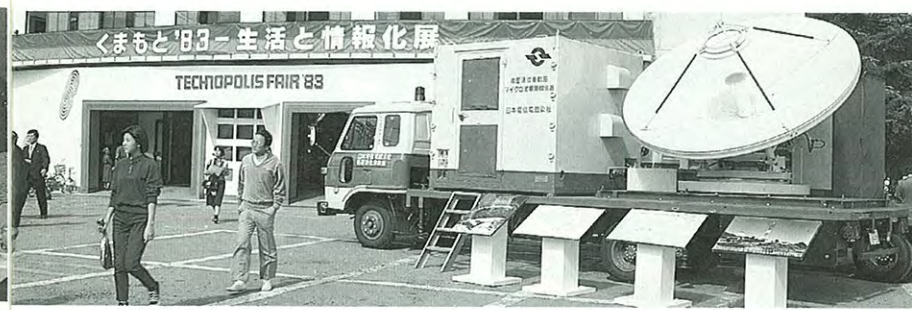
● 三宅島噴火による通信途絶で活躍した電々公社の衛星通信もおめみえ