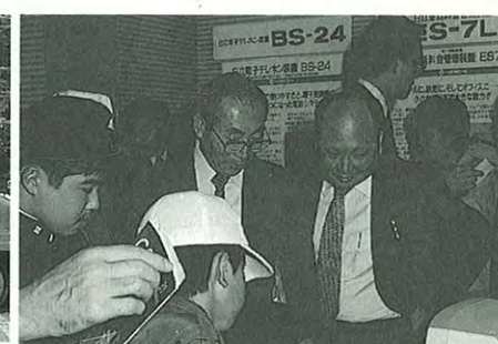
● 関心が高いオフィスオートメーションコーナー(2)