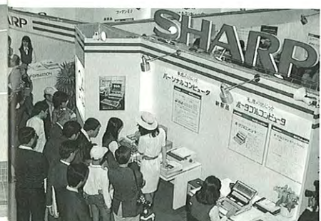
● 関心が高いオフィスオートメーションコーナー(1)