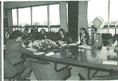
● 外人記者5人とテクノポリス構想、企業誘致施設等について討論