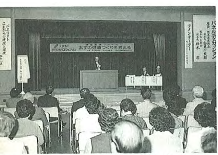
● 市役所14階大ホールで行われた地域医療フォーラム