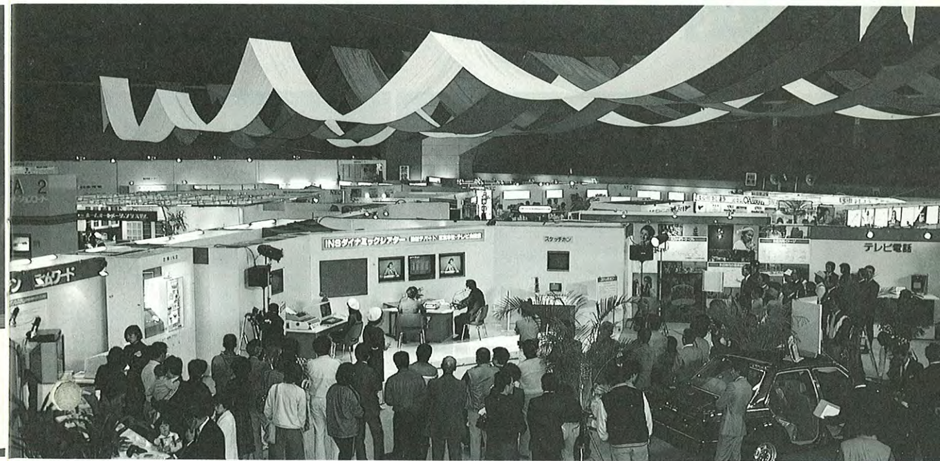
● テレビ会議を実演する電々公社INSダイナミックシアター