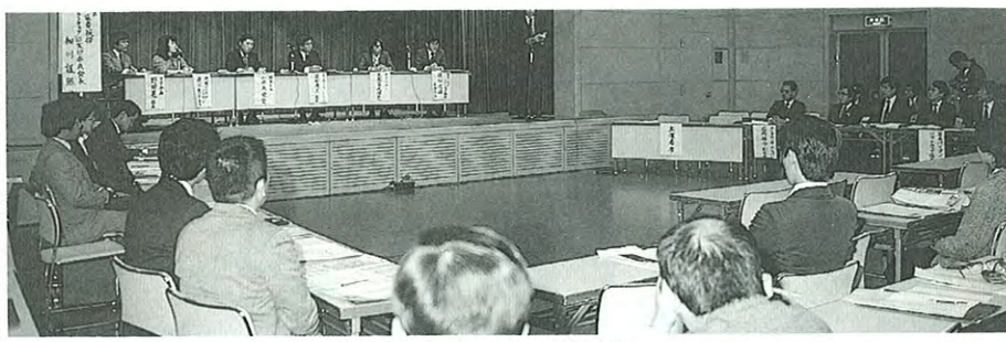
● 国内パソコンソフトトップ技術者による討論会