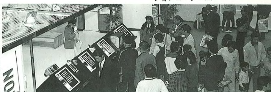
● 賑わいをみせるホームオートメーションコーナー(未来の家)