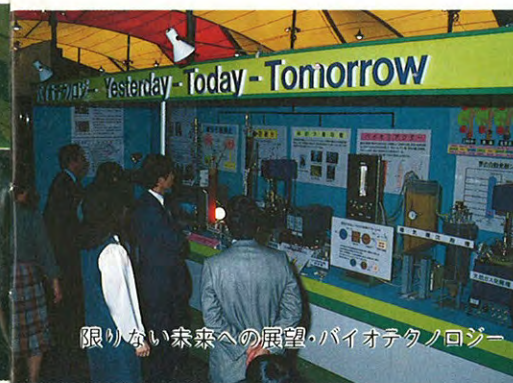
限りない未来への展望・バイオテクノロジー