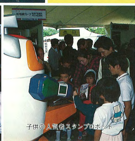
子供の人気者スタンプロボット