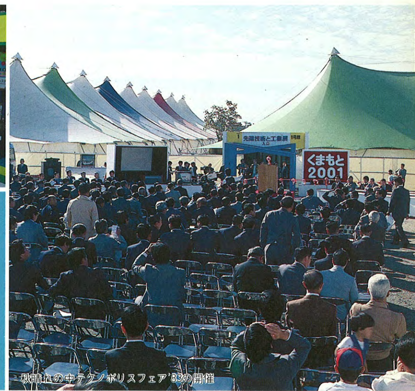
秋晴れの中テクノポリスフェア'83の開催