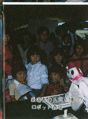
乗場者の人気を博した ロボット酒場