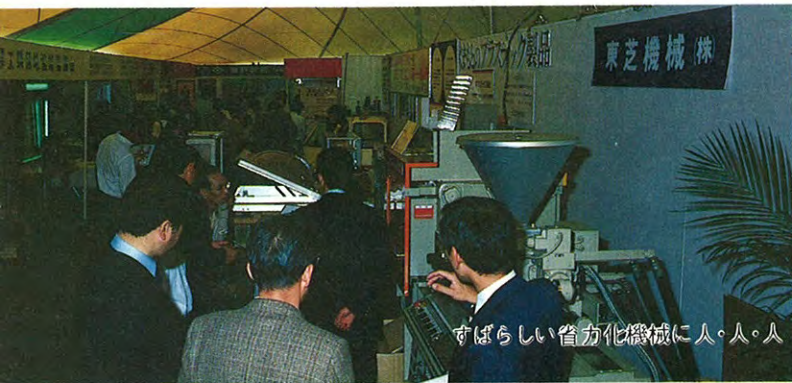
すばらしい省力化機械に人・人・人