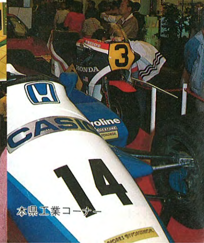
本県工業コーナー