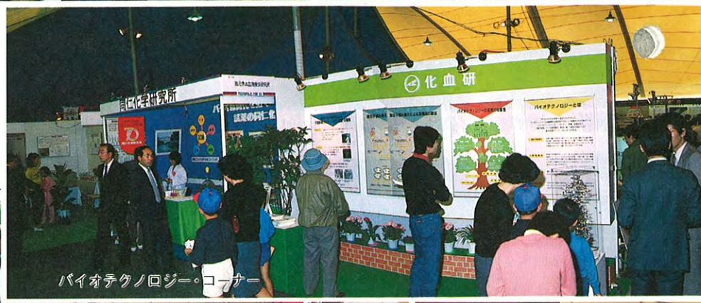
バイオテクノロジー・コーナー