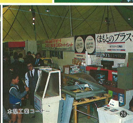
本県工業コーナー