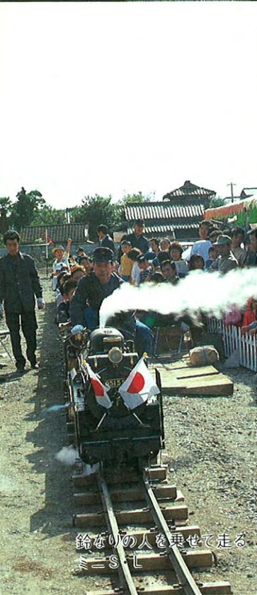
鈴なりの人を異せて走る ミニSL