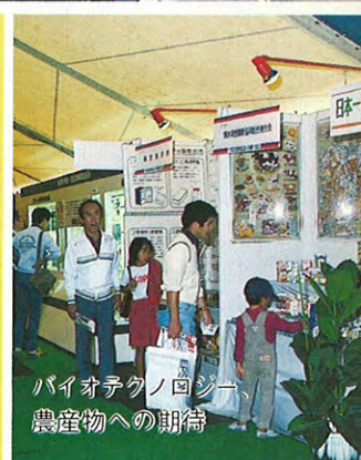
バイオテクノロジー 農産物への期待

くまもとテクノポリスと県産業の持つ先端産業、情報産業の現状、未来について県民の理解を得ることを目的に、くまもとテクノポリスフェア'83が十月三十日から十一月三日までの五日間、熊本市水前寺周辺を中心に開催された。 総入場者は十一万三千人を越え、県民の強い関心と注目を集めた。並行して開催されたテクノポリスのタペヤフォーラムにも多くの参加者を集め、この力がテクノポリス実現に結びつくものと期待される。