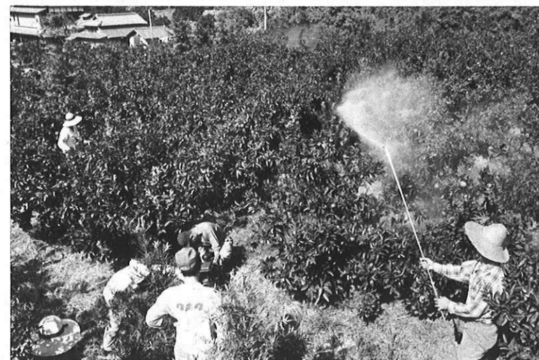
▲みかんの共同防除作業。

農業構造改善事業や制度融資の拡充によって、経営の規模拡大と自立経営農家の育成につとめ、生産の協業化、共同化が進められていく。