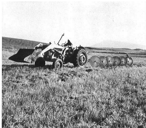
▲新しい技術を駆使した草地畜産を推進。