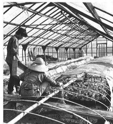
▲施設園芸、野菜集団産地化も活発に。