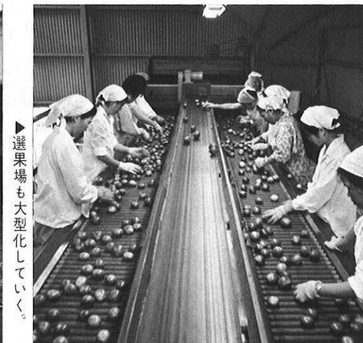
▶選果場も大型化していく。