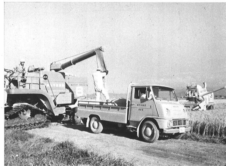
▲高性能の機械で生産性を高めていく。