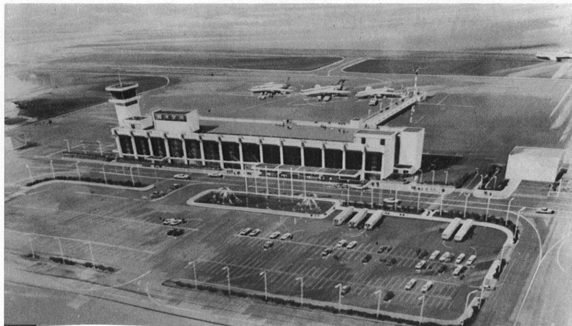
下・新熊本空港、第一期工事の完成予想図。手前はターミナルビル