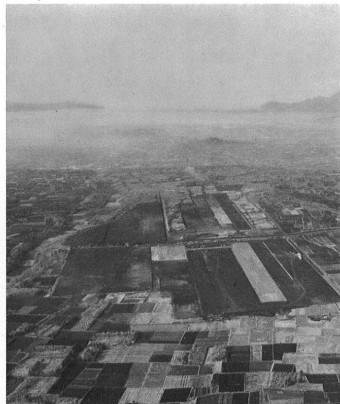
上・建設中の新熊本空港

新熊本空港は四十五年度には二千五百坪の滑走路やターミナルビルなどが完成し、四十六年の春には一番機が飛び立つ予定。さらに、建設工事中の九州縦貫自動車道は、九州初のハイウェイとして昭和