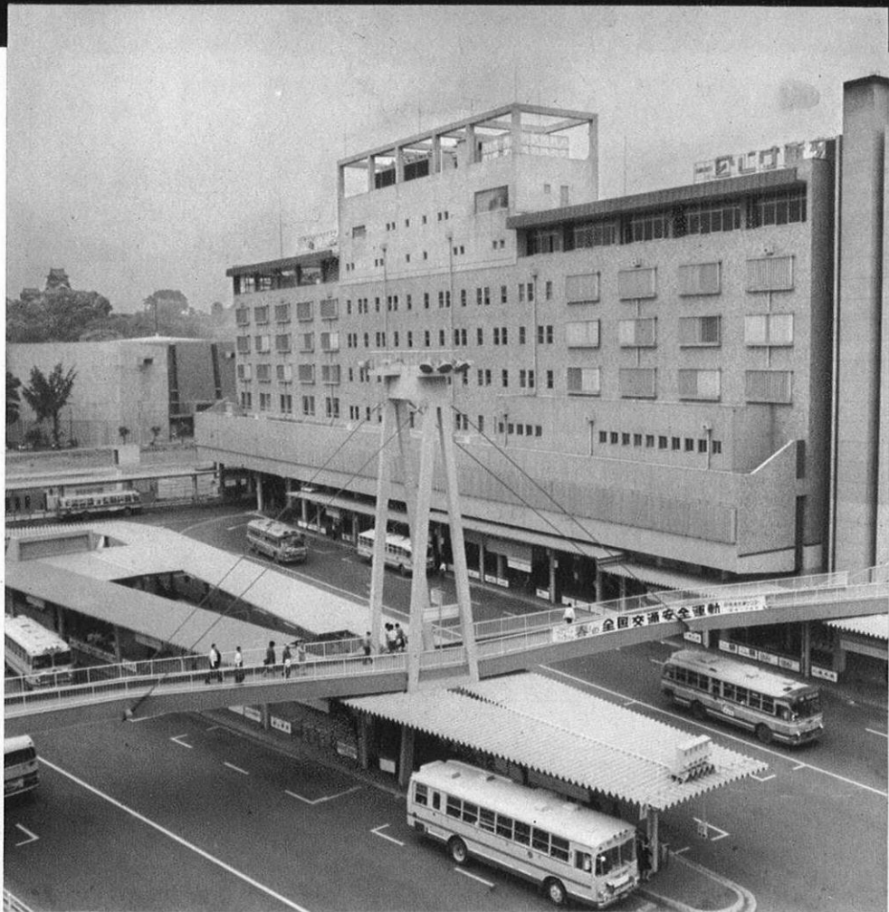
上・広いバスターミナルと近代設備をほこる熊本交通センター