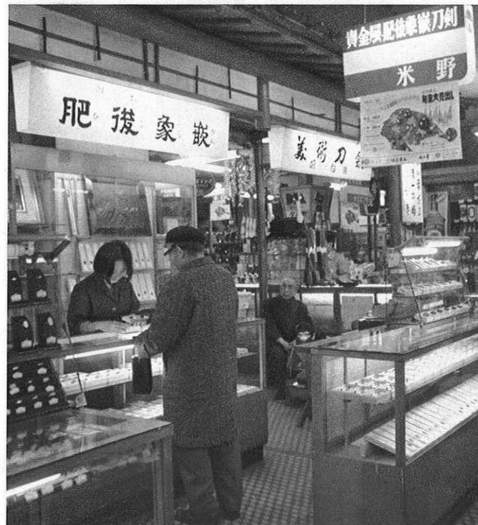
▼観光物産コーナーで肥後象嵌を求める観光客も多い。