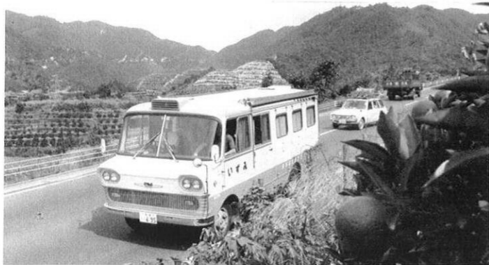
◀ 町から村へ…きょうは、甘夏の里、田浦町へ！