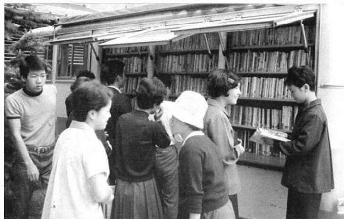
▲ 農村部では、若い人たちの読書欲が目ざされている。〈ベストセラーも読みたいし、園芸の専門書も借りたいし…文学ものを系統立てて読破したいし…〉いずみ号の周辺はいつもにぎわっている。(田浦町にて)