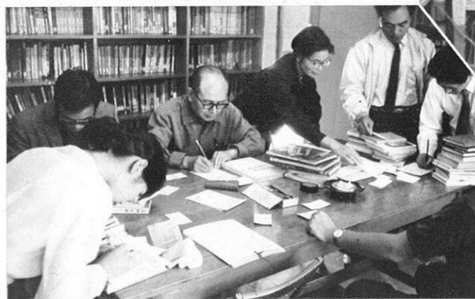
▲ 貸出し本の受付整理をする人たちの手さばきもなれたもの。本が痛んでないか気を配りながら……。