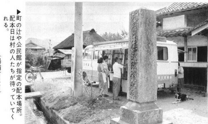
▶ 町の辻や公民館が指定の配本場所。配本日は村の人たちが待っていてくれる。 (湯浦町にて)