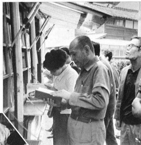
▲ いずみ号がフタをあけると書架には本がいっぱい。どれにしようかなー。 (田浦町にて)