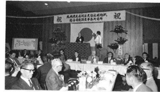
5.20-阿蘇・久住・飯田地域総合開発調査事務所が開所。高原農業開発もいよいよ軌道にのった。