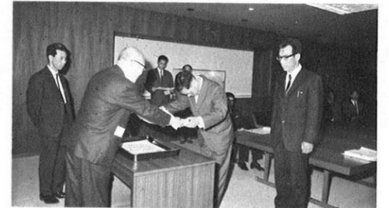
4.21-創意工夫功労者表彰(科学技術庁)のうち本県関係者(学校と個人11名)の表彰伝達式が知事応接室で行なわれた。