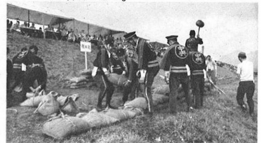
5.16-雨期をひかえて、恒例の防災訓練が甲佐町の緑川畔で行なわれた。自衛隊も参加して訓練は終始熱をおびた。

県政ハイライト★KENSEI HAI RAITO★けんせいはいらいと★県政ハイライト★