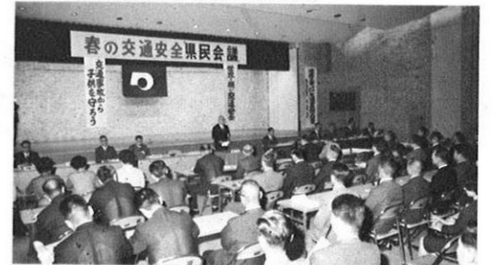
5.8-春の交通安全県民会議が開かれた。この会議で「熊本県交通安全憲章」が採択された。