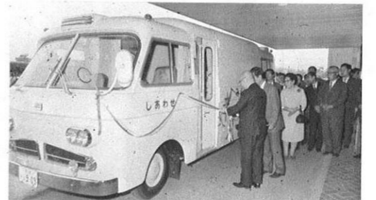
5.10-県の結核予防対策の一環として、新たに検診レントゲン車「しあわせ号」を購入。これで7台目になる。