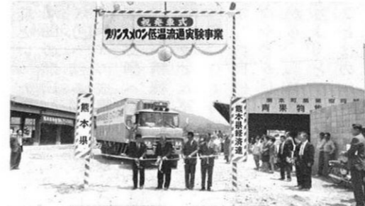
5.23-好評の熊本プリンスメロンの出荷は軌道にのり、鮮度の高いものを輸送するコールドチェーン(低温輸送)の試験が行なわれた。