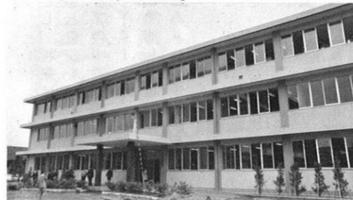
6.3-従来の熊本県衛生研究所と熊本中央保健所が新庁舎に入った。