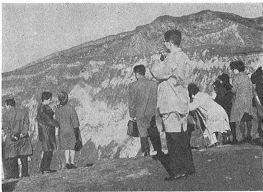
△観光客の受入体制の充実へ▽