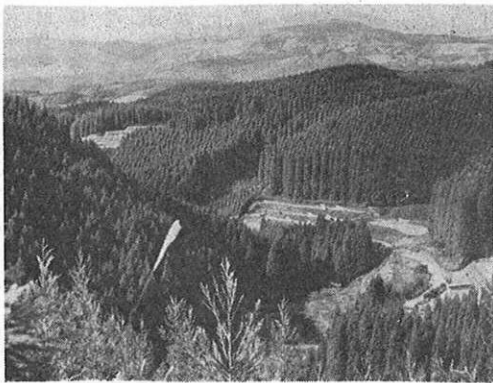
森林資源の保護と林業経営の近代化へ

四十四年から国の新規事業として漁業近代化資金融資制度が発足することになったので、ことしは融資枠二億五千万円を予定。これに対する利子補給費として四百万円が計上された。