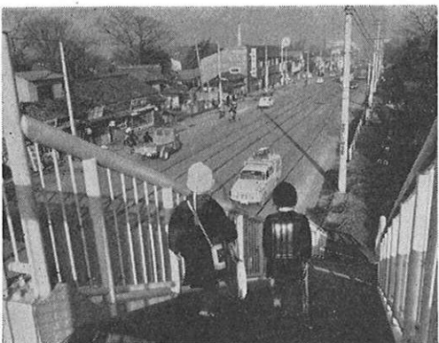
△交通安全施設の整備を推進▽