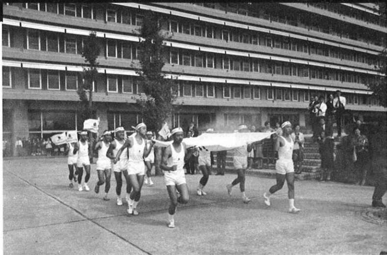
上・県庁を出発する聖火リレー隊。

明治百年記念式場から天草の県体育祭会場へ初の聖火リレーが行なわれた。聖火は県旗といっしょに式典会場から出席者の拍手に送られ県庁をスタート、天草五橋を渡って県体育祭会場が行なわれる本渡市陸上競技場へ