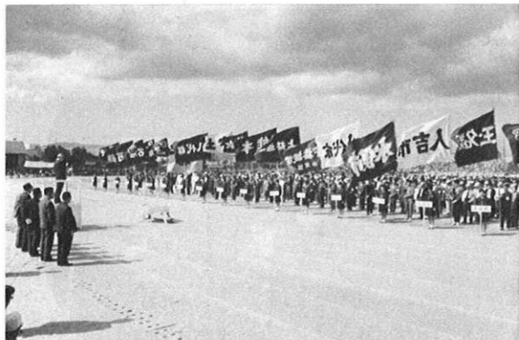
上・聖火を迎えて幕をひらいた天草県体育会場。 下・秋晴れの空に聖火が高かざされて…。

明治百年記念式場から天草の県体育祭会場へ初の聖火リレーが行なわれた。聖火は県旗といっしょに式典会場から出席者の拍手に送られ県庁をスタート、天草五橋を渡って県体育祭会場が行なわれる本渡市陸上競技場へ