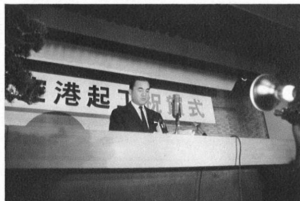
下・起工式のあと、県庁大会議室で開かれた祝賀式で、告辞を述べる中曽根運輸大臣