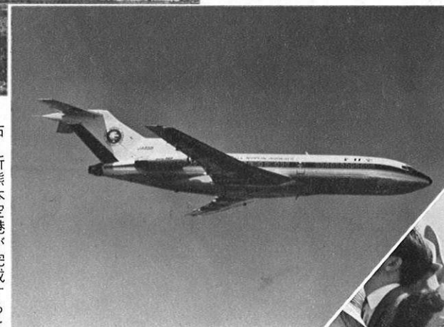
右・新熊本空港が完成するとボーイング七二七や七三七が発着することになる (写真はボーイング七二七)