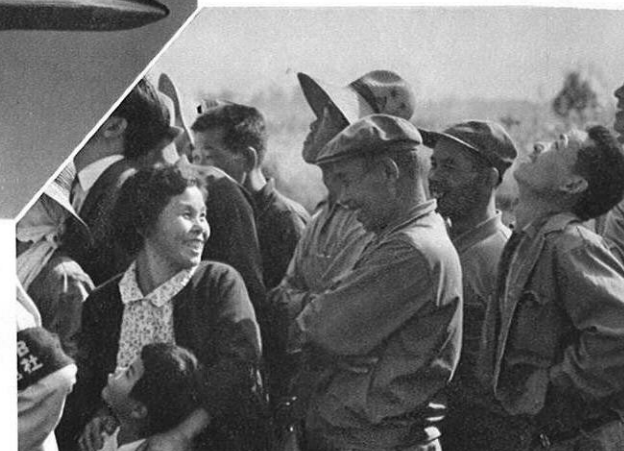
上・式場には野良着姿のままの地元の人たちの姿も……