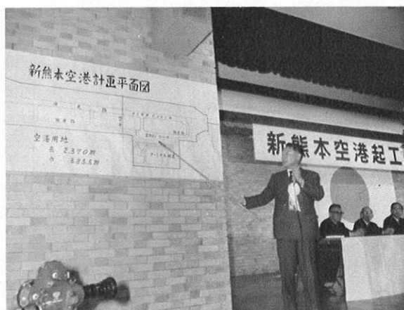
上・尾崎運輸省才四港湾建設局長から新空港の建設計画が説明された。