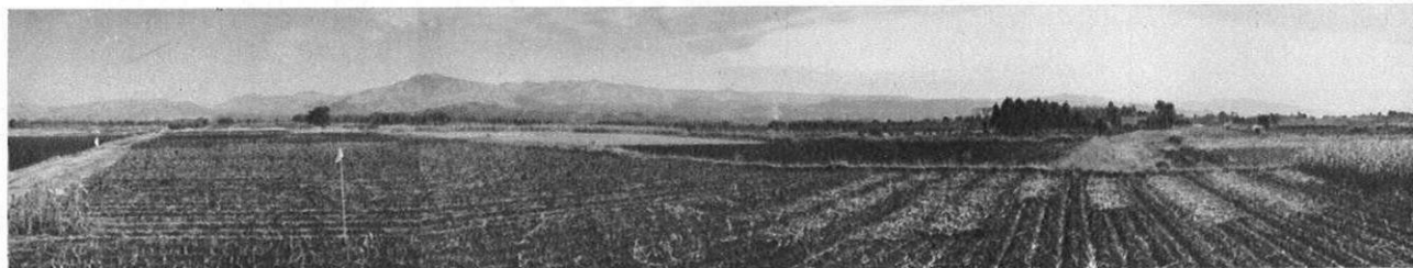
上・新熊本空港建設地の全景。2年後にはこの台地に長さ2000M幅45Mの滑走路ができ、ジェット機が発着するのである。