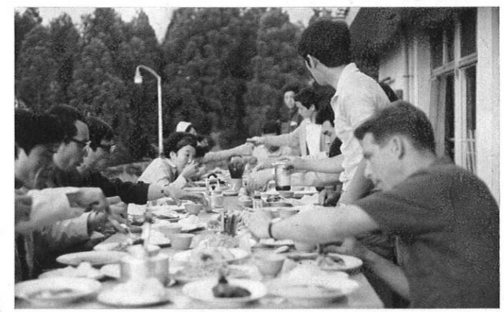
左・食事の場は、また国際友好の場ともなる