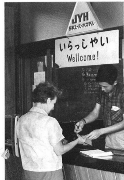
左・ユース・ホステルは、多くの若い人たちに利用されている