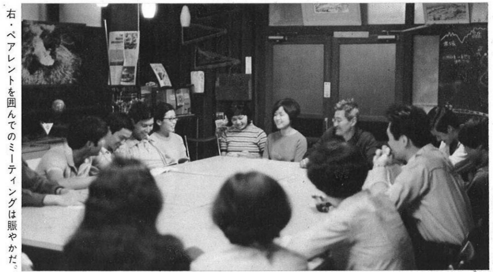
右・ペアレントを囲んでのミーティングは賑やかだ。