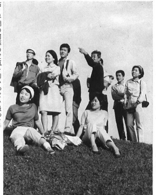
右・早朝の阿蘇の空気を胸いっぱい吸って。