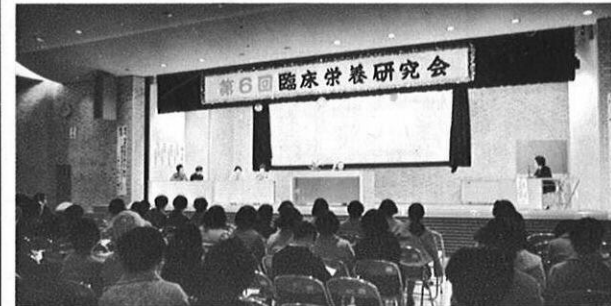
2.21 九州各県栄養士の研究発表をかねて臨床栄養研究が京大桂教授を招いて開かれた。(県庁大会議室)