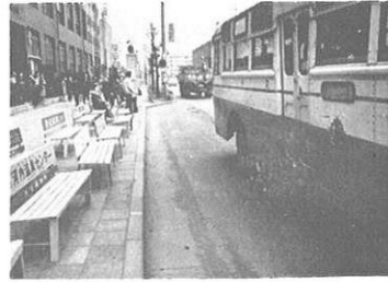
▼ バス停車帯の改良