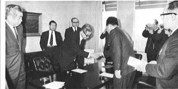
2.10 緑川流域の農業開発をめざす緑川ダム建設関係の補償調印が県・九地建・地元の間で行なわれた(県庁にて)