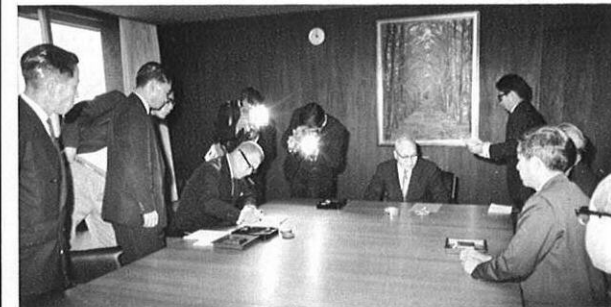
2.24 昭和45年10月完成を予定とする、鹿児島本線熊本～鹿児島間の電化利用債引受調印が行なわれた(知事応接室)