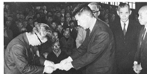
3.17 九州縦貫自動車道用地買収に伴う日本道路公団と地元側の契約調印が地元鹿央村で行なわれた。