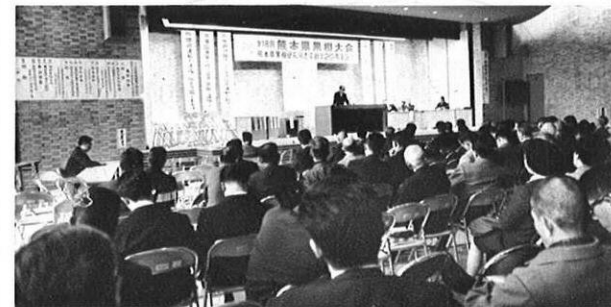
3.5 果樹振興をはかるための恒例の第18回果樹大会がひらかれた。(県庁大会議室)