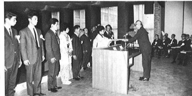
2.29 昭和42年度農業コンクールを開催。ことしも優秀農家経営者が数多く選ばれた。(県庁大会議室)