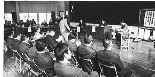
3.5 運輸省の主催で新空港公聴会が地元大津町公民館でひらかれた。