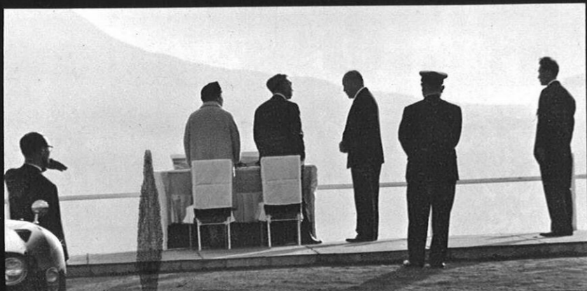
城山展望所から阿蘇五岳をのぞまれる両陛下。