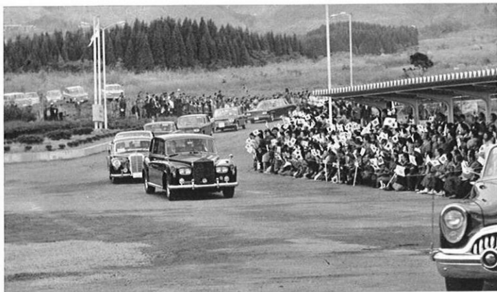
県境を越え、南小国村の三愛レストハウスにご到着。