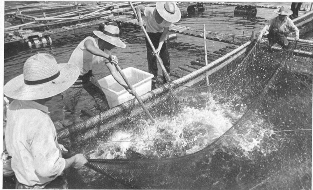
上・ハマチ・タイ・フグなどの養殖研究が中心の牛深分場（写真はハマチの養殖風景）