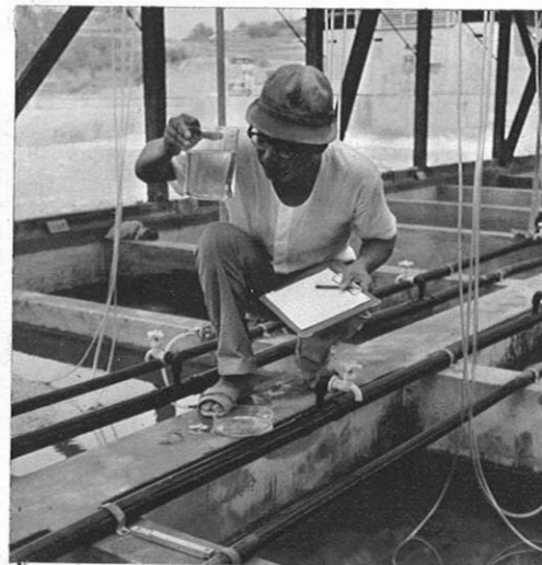
左・車エビの稚魚をみる