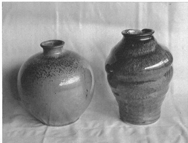
上・やきもので一番むつかしい過程はろくろ作業だといわれる。 左・見事な水の平焼の作品

天草陶石を原料とし、独特の海鼠（なまこ）色の美しさで、多くの人から好まれ親しまれている水の平焼は、明和二年の創業以来、約二〇〇年の伝統を受け継いでいる。 今の窯元は六代目で、代々続いた素朴な海鼠色の美しさを保存しながらも、時代の移り変わりや、現代人の好みを反映して、少しずつ色も変わってきている。