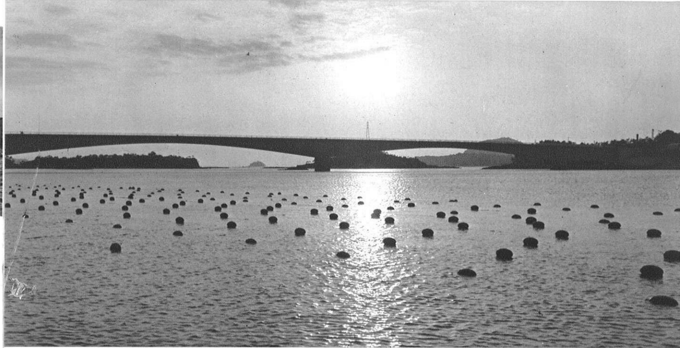
上・コンクリート打放しの前島橋（4号橋）はみやびやかな線で夕映えの水面を走る。 （手前の黒い点々は真珠養殖用のブイ） 下・ダイナミックなパイプが青い海に大きく朱色の弧を描く松島橋（5号橋）