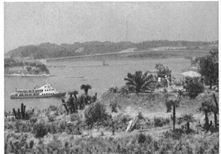
上・南国情緒ゆたかな亜熱帯植物園 下・5号橋を下から見上げると……