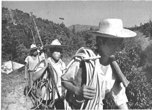
★かつての段々島もみかん園に