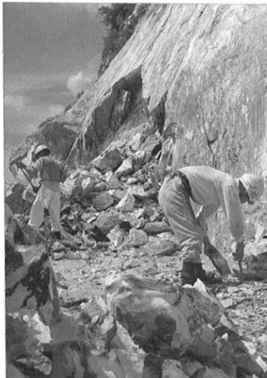
★質量とも日本一の天草陶石（高浜）