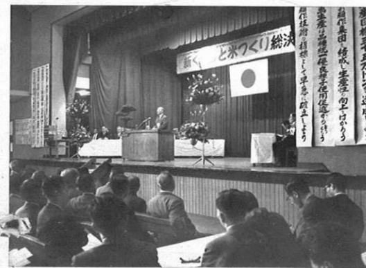
5. 22- 米の増収と品質向上をはかるため新くまもと米づくり総決起大会を開催