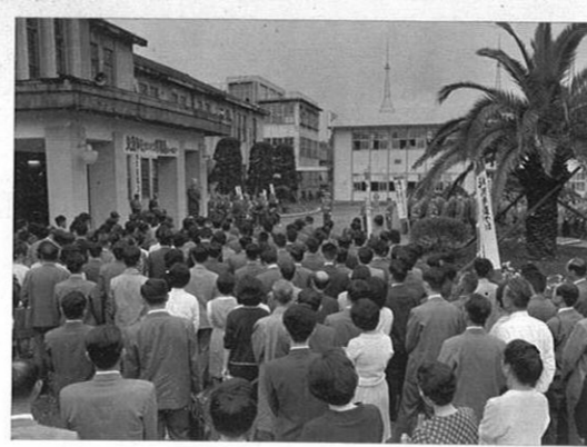
5. 11- 交通事故をなくする県職員の集いが…