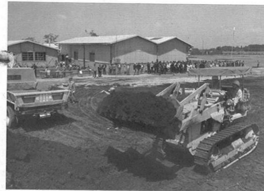
5. 16- 産業開発青年隊訓練所では産業開発青年隊の日を開設