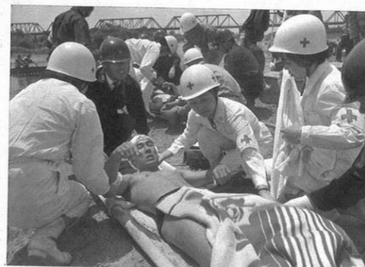
5. 27- 恒例の総合防災訓練が菊池河畔で展開された