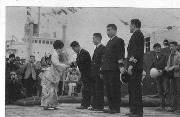
4. 3- 改修中の八代港が貿易港として開港