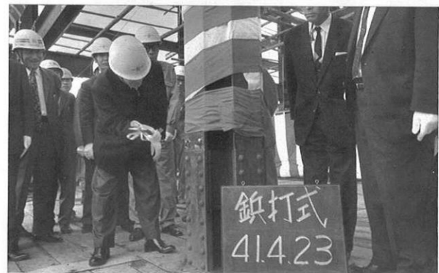
4. 23- 新県庁舎の鋏打式が行われた