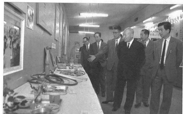
5. 7- 児童憲章制定15周年を記念して、児童福祉大会や児童福祉展が開かれた。

★ 県政ハイライト ★ 県政ハイライト ★ 県政ハイライト ★ 県政ハイライト ★ 県政ハイライト ★ 県政ハイライト ★