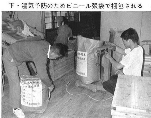
下・湿気予防のためビニール張袋で梱包される