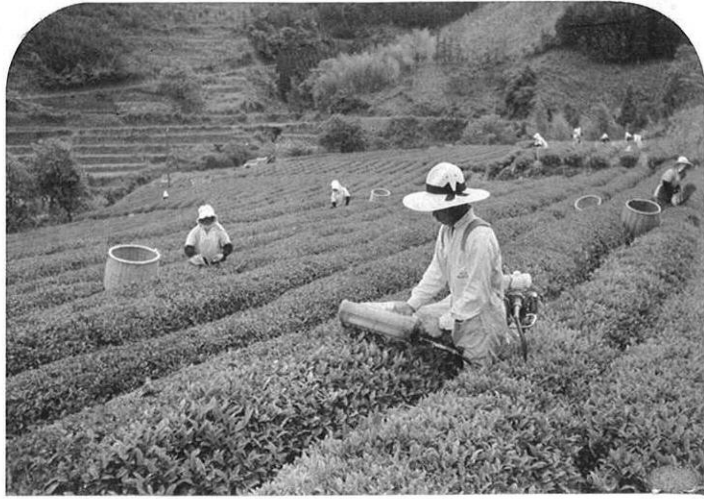
右・ゆるやかな傾斜の見事な茶園が山麓一帯にひろがる。