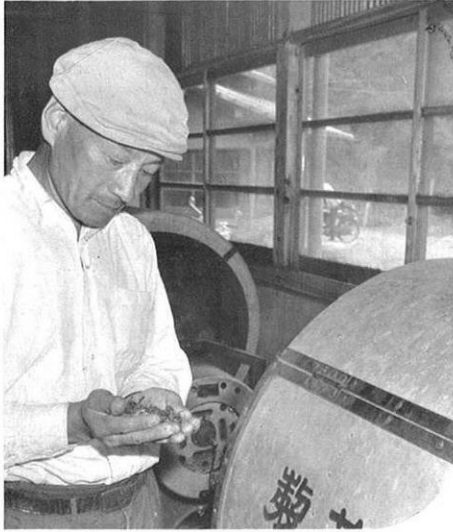
上・製茶再乾機で60%ぐらいが仕上がる。この後、精乾機にかけられ茶のツヤがつけられる。