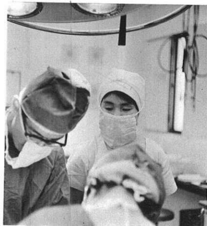
上・手術室にて…真剣なまなざし