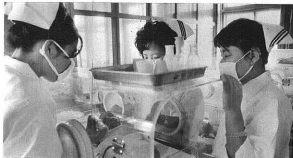
上・今日は先輩から未熟児の扱い方の実習をうける