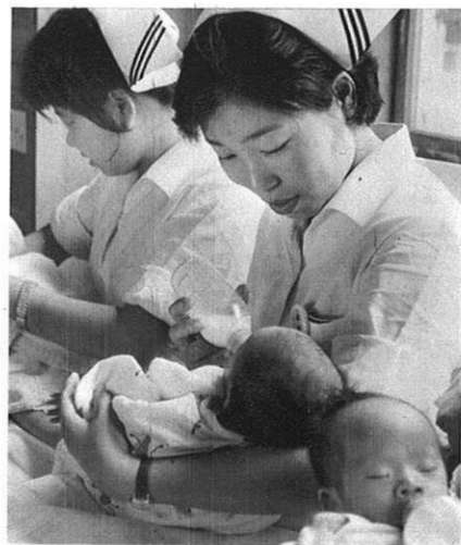
上・乳児を抱く時フトお母さんを…