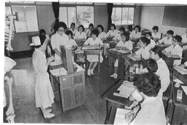
上・看護学、解剖生理学等々みっちり学科の勉強が…