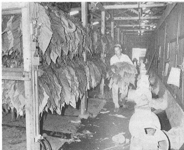
表2 農業生産額の見通し (単位: 億円)