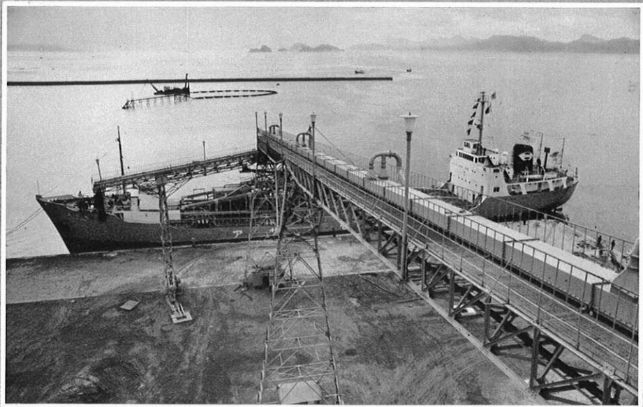
上・もう大型輸送船が次々と工業用資材を運んで…